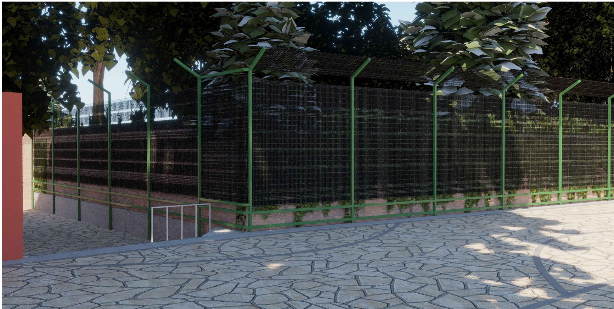
IMAGEN VIRTUAL CON VISTA GENERAL DE REJA DE SEGURIDAD CONSERVANDO EL MISMO NIVEL SUPERIOR EN TODO SU DESARROLLO